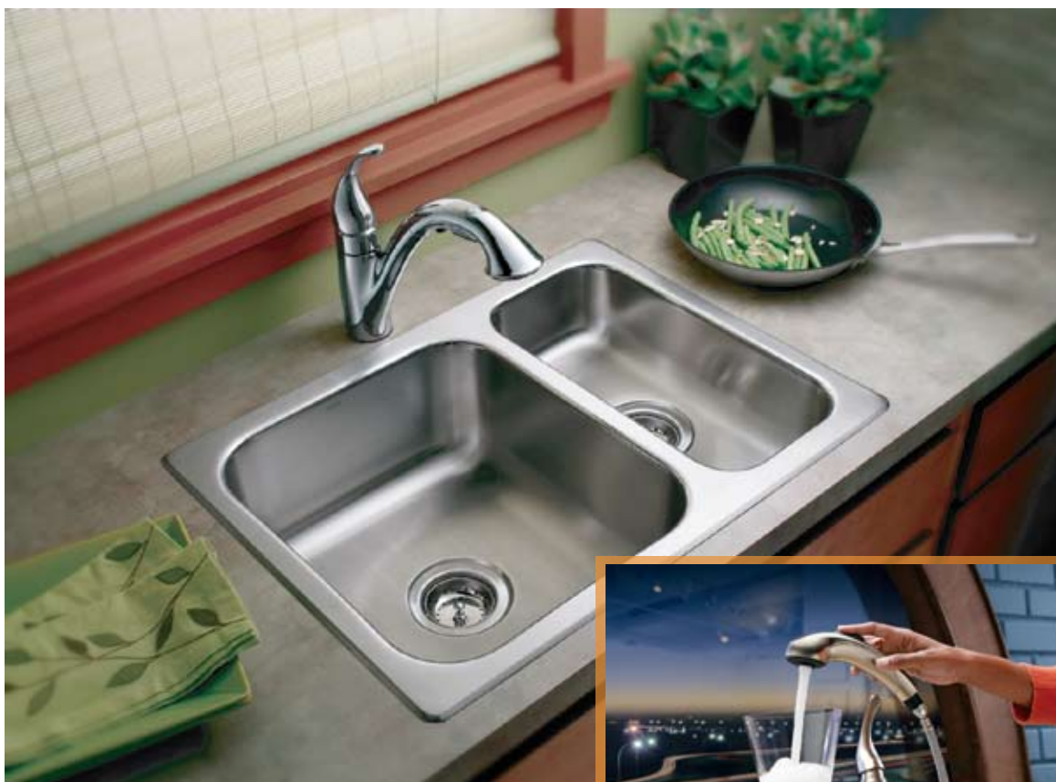
MOD. ILUSTRADO CAMERIST 7545C