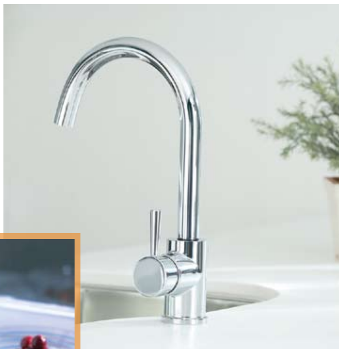
MOD. ILUSTRADO LEVEL 7100