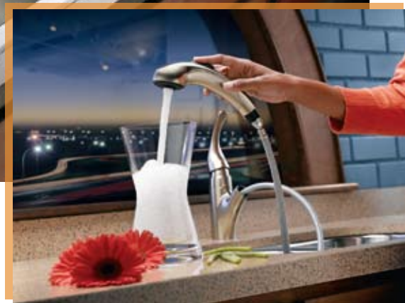
MOD. ILUSTRADO INTEGRA 67315C