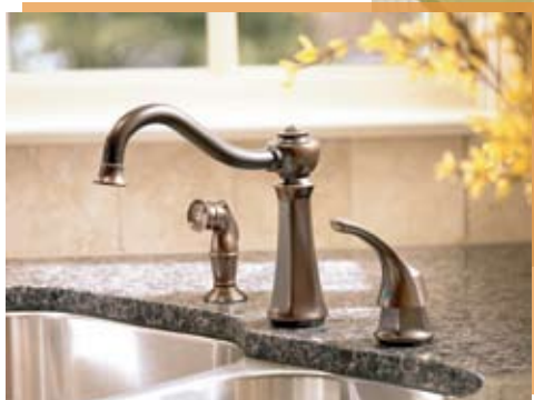
MOD. ILUSTRADO VESTIGE 7065ORB

Requiere Hidroneumático (1.33 kg/cm 2 : 20 lbs/pulg 2 )