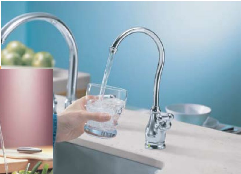
MOD. ILUSTRADO PURETOUCH AQUASUITE 77200