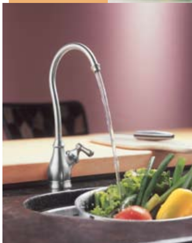
MOD. ILUSTRADO PURETOUCH AQUASUITE 77200SL