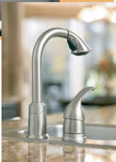
MOD. ILUSTRADO CAMERIST 5955SL