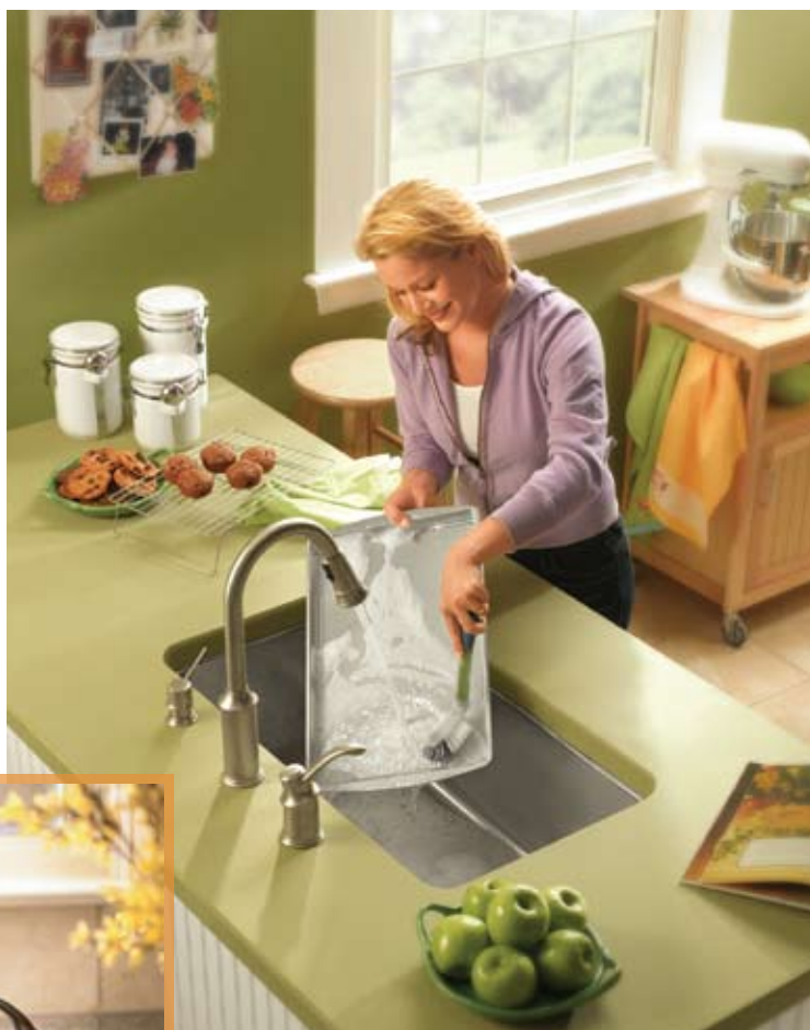
MOD. ILUSTRADO ABERDEEN 7590SL