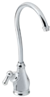
77200 Puretouch Aquasuite Sistema de filtro de agua. Instalación en tarja o lavabo.

Acabados Disponibles: C-Cromo, SL-Acero Inoxidable.