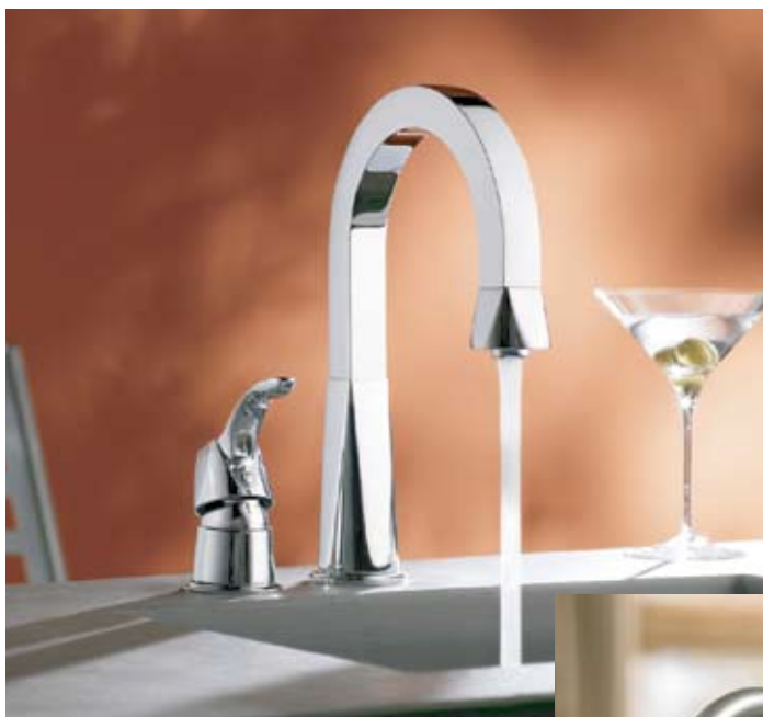
MOD. ILUSTRADO DIVINE S658